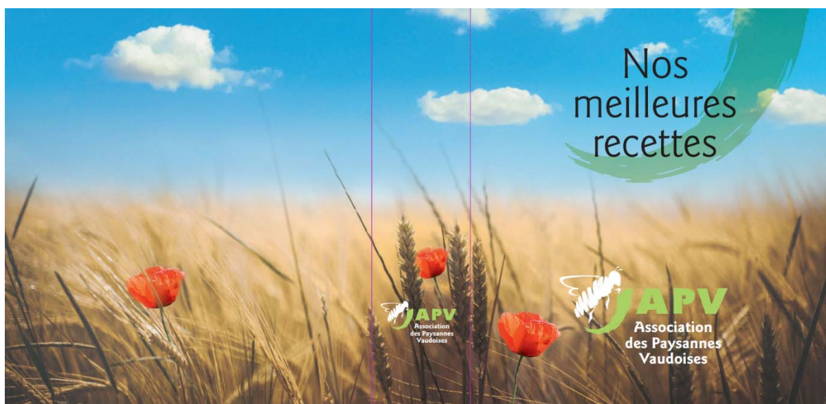
Couverture du nouveau classeur de recettes

Ce projet permet de soutenir l'agriculture vaudoise, de mettre en valeur les produits du terroir, de redonner le goût du bien-manger, de revisiter le patrimoine culinaire vaudois et de l'apprécier sous toutes ses formes.